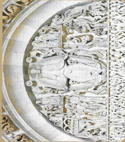
Jugement dernier: Cambronne d'Avant (MP, société)

NOS SOCIÉTÉS SONT-ELLES GOUVERNÉES PAR LA PEUR ?