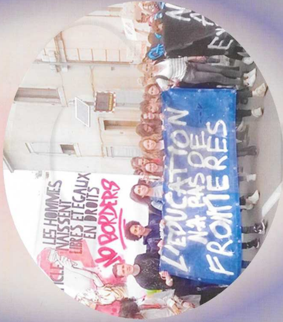
Manifestation de lycéens espagnols contre l'expulsion de plusieurs pays en 2017

LES DROITS DE L'HOMME ONT-ILS UN AVENIR ?