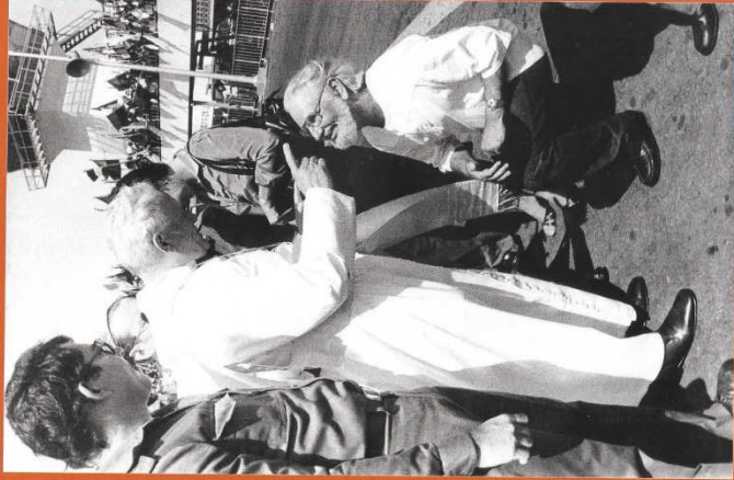
A Managua, au Nicaragua, en 1982. Jean-Paul II réprimande Ernesto Cardenal

n° 95 – novembre-décembre 2019 ISSN n° 1294-4973